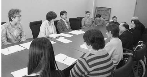
障害者の生活と権利を守る県連絡協議会のみなさんと懇談（11月30日）