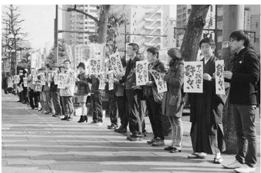
毎月3日午後1時、全国各地で「アベ政治を許さない」行動（1月3日）