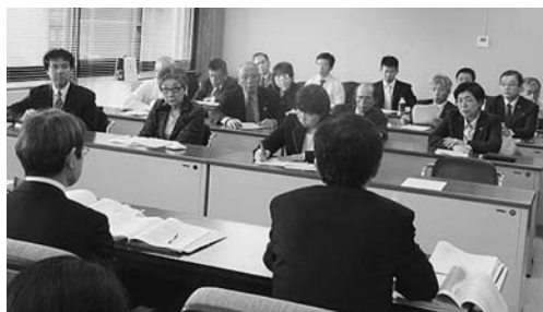
提出した要望書にもつき県の各部と交渉（向う側は日本共産党の地方議員。12月25日）