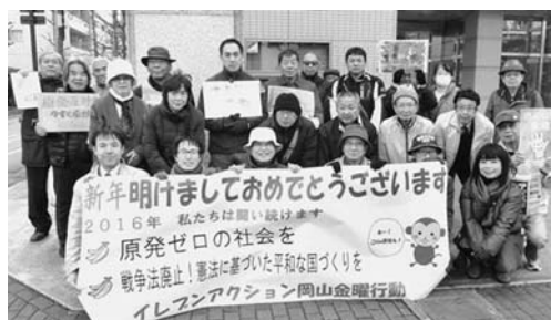
毎週金曜日昼休み、中国電力前での原発ゼロの社会をめざすイレブンアクション（1月8日）